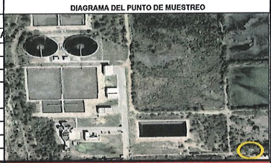
DIAGRAMA DEL PUNTO DE MUESTREO